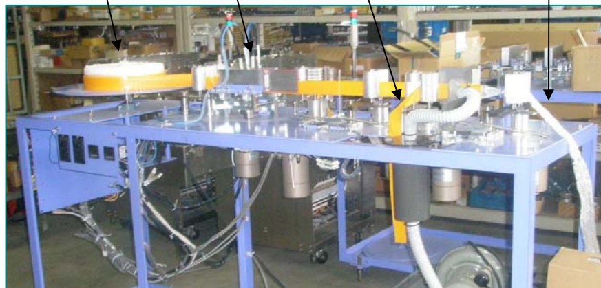
ターポリンの分離機

この方法は、蟹江プロパン社が独自に開発した方法で、当初は温水に漬けて剥離する、溶剤に漬けて剥離するなど色々な検討を行った中から、熱板中を通すことにより、非常に短時間で簡単に塩ビと他素材を分離できることが分かり、この装置の開発に至りました。熱板は、複合素材の製造時に出る長尺の耳屑で幅10cm未満、長さ100m超のものを対象に開発を行いました。それでも熱板は非常に小さく、耳屑との接触時間は数秒です。